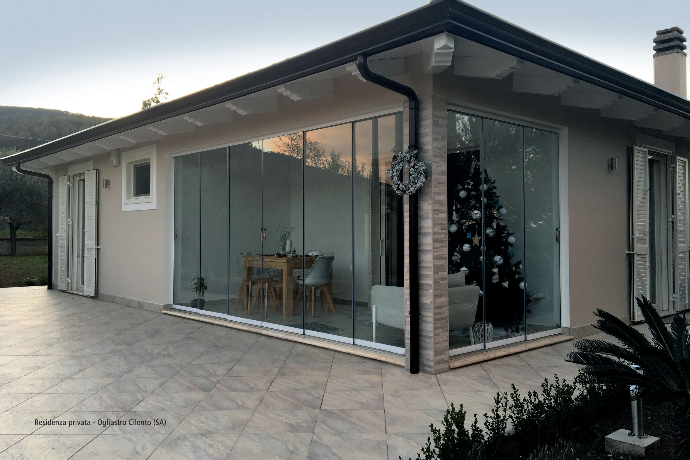
Residenza privata - Ogliastro Cilento (SA)