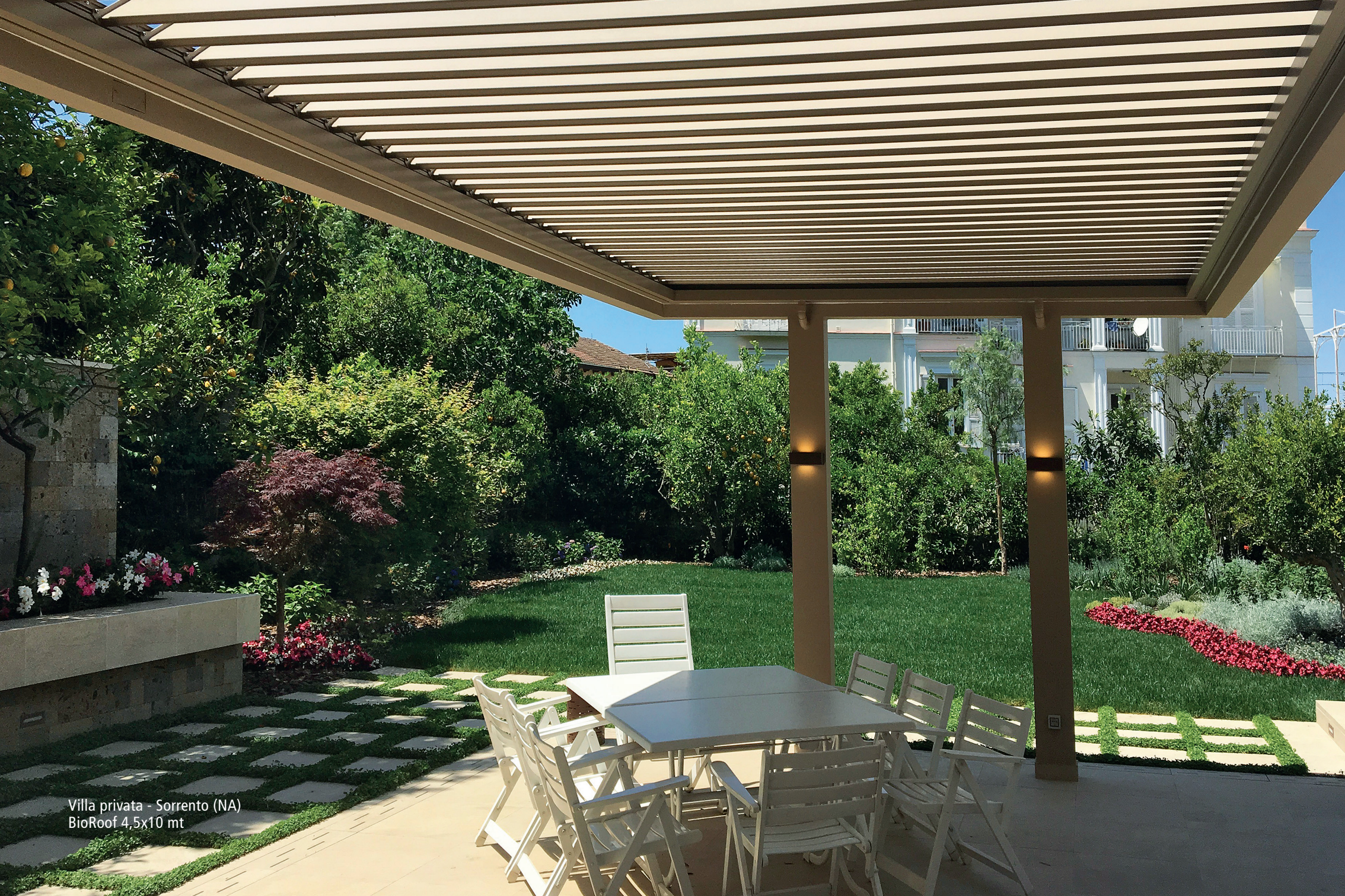
Villa privata - Sorrento (NA) BioRoof 4,5x10 mt