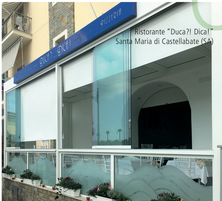
Ristorante "Duca?! Dica!" Santa Maria di Castellabate (SA)

Le VETRATE sono il sistema di copertura e chiusura per giardini d'inverno, serre solari e verande più innovativo ed esclusivo. Una serie di profilati in alluminio consente la costruzione di copertura o chiusura, dall'estetica minimale ed essenziale, uniche nel loro genere, fisse e mobili. La flessibilità della vasta gamma di prodotti permette di realizzare giardini d'inverno completi, verande e serre solari su misura, per abitazioni private, locali pubblici, centri sportivi, secondo le normative vigenti in merito di risparmio energetico.