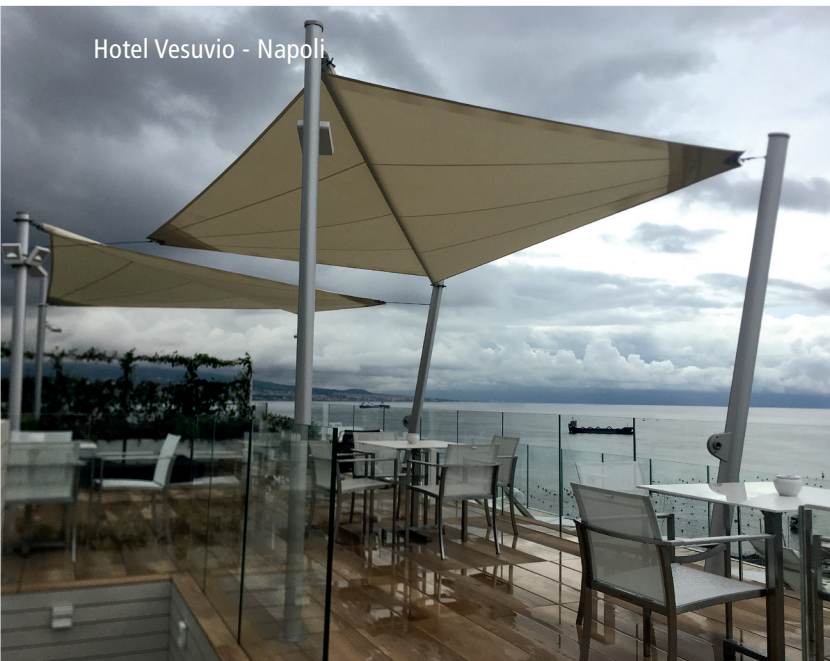
Hotel Vesuvio - Napoli