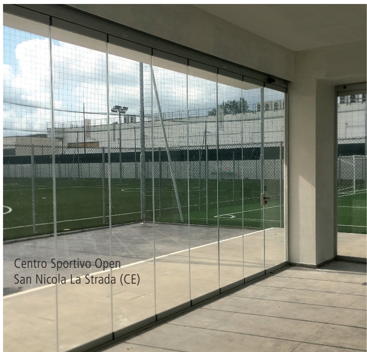
Centro Sportivo Open San Nicola La Strada (CE)

Le VETRATE sono il sistema di copertura e chiusura per giardini d'inverno, serre solari e verande più innovativo ed esclusivo. Una serie di profilati in alluminio consente la costruzione di copertura o chiusura, dall'estetica minimale ed essenziale, uniche nel loro genere, fisse e mobili. La flessibilità della vasta gamma di prodotti permette di realizzare giardini d'inverno completi, verande e serre solari su misura, per abitazioni private, locali pubblici, centri sportivi, secondo le normative vigenti in merito di risparmio energetico.