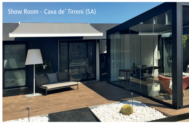
Show Room - Cava de' Tirreni (SA)

Le TENDE DA SOLE sono un prodotto moderno, funzionale e semplice da installare, disponibile sia in versione automatizzata che manuale. Oltre a proteggere dal sole, si adattano perfettamente ad ogni contesto, dai più tradizionali ai più sofisticati, impreziosendoli e personalizzandoli. Possono essere protette da tettuccio, carter o cassetto. Sono ideali per balconi, giardini e spazi esterni e si distinguono per le loro importanti caratteristiche tecniche, che le rendono altamente funzionali. Oltre ai tradizionali materiali moderni quali l'alluminio e l'acciaio, realizziamo su progetto tende e particolari interamente in ottone.