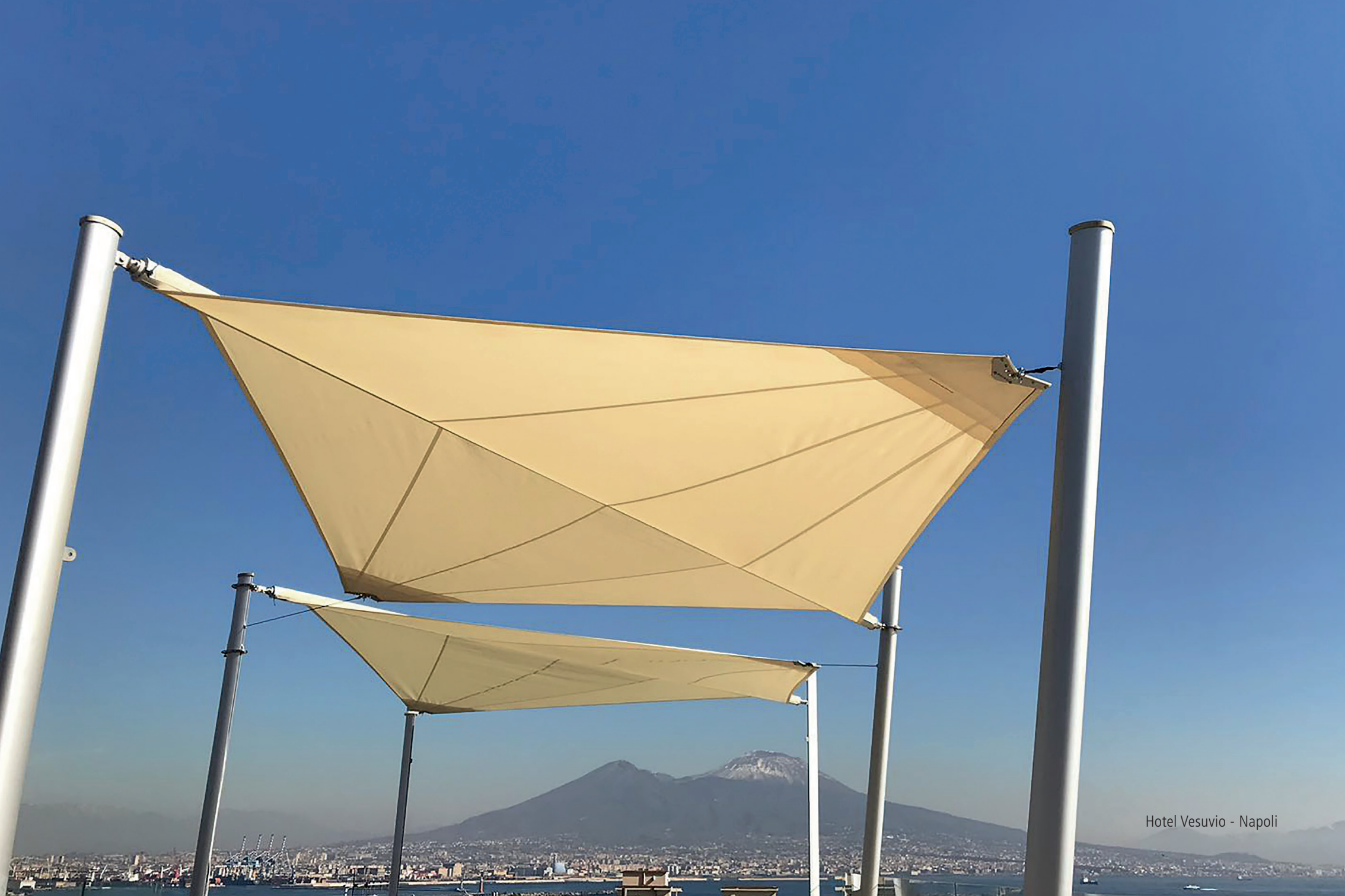
Hotel Vesuvio - Napoli