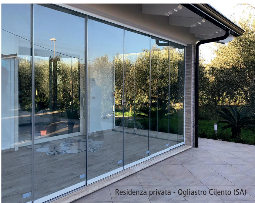
Residenza privata - Ogliastro Cilento (SA)