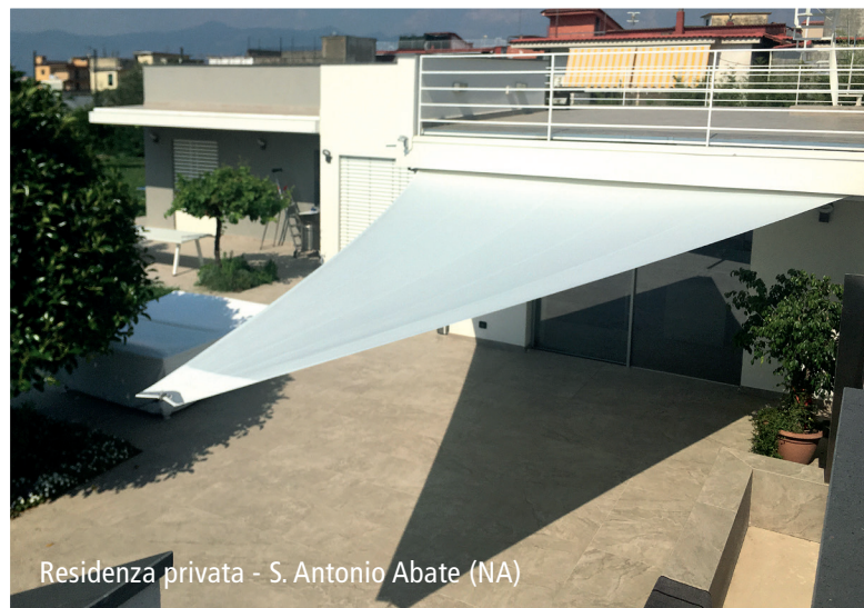
Residenza privata - S. Antonio Abate (NA)