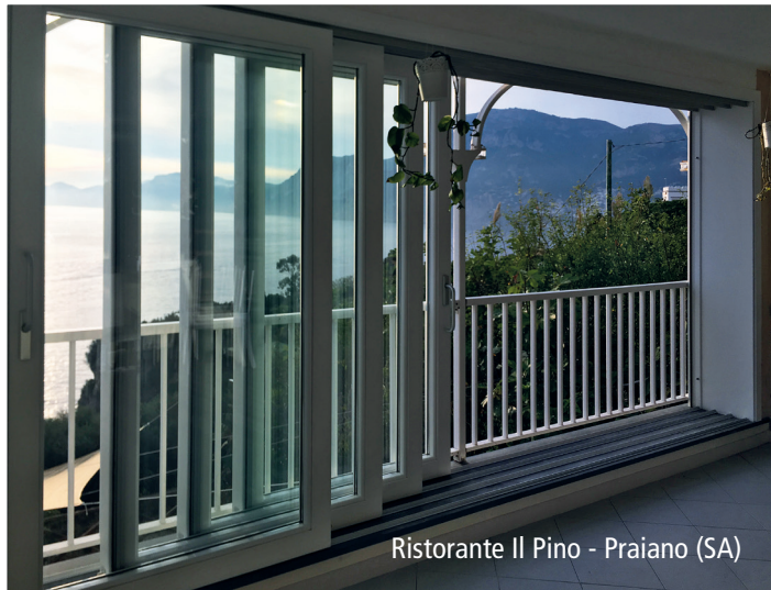
Ristorante Il Pino - Praiano (SA)