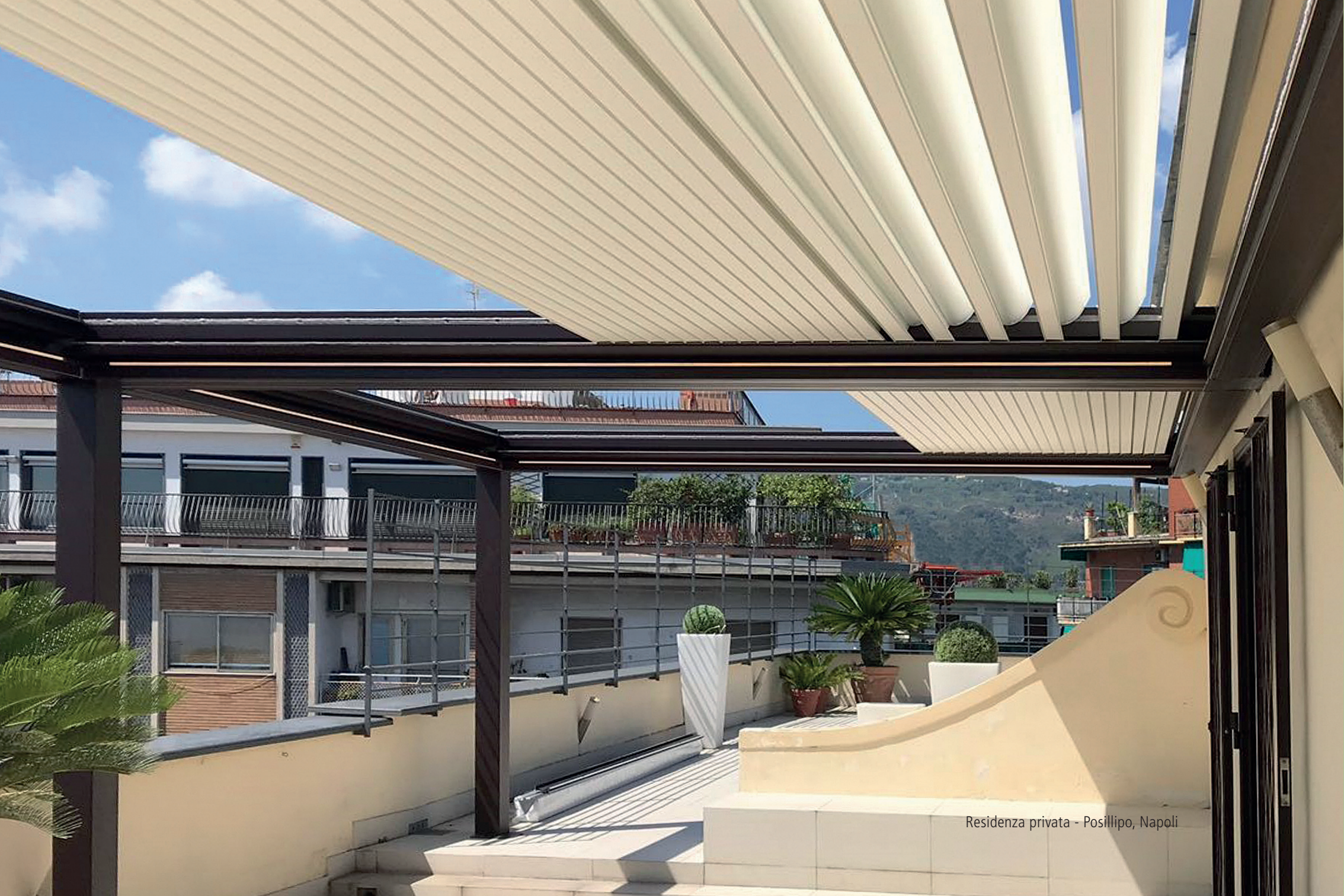
Residenza privata - Posillipo, Napoli