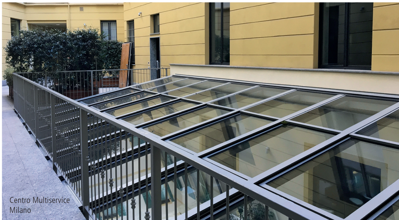
Centro Multiservice Milano