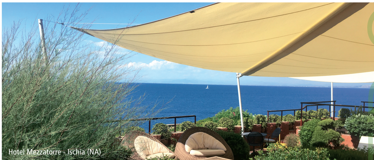
Hotel Mezzatorre - Ischia (NA)